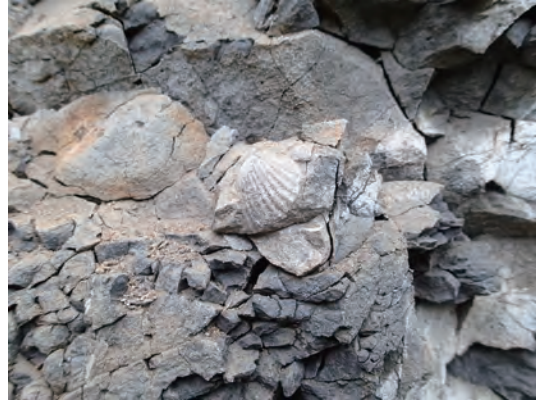
白糠町右股の地層中に埋まっている化石

第一回：白糠町右股の地層で、3000万年前の貝化石を探します。石ころのようなノジュールに包まれている化石が多いですが、巻き貝や二枚貝の化石が見つかります。