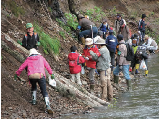
足寄町螺湾での化石採集の様子