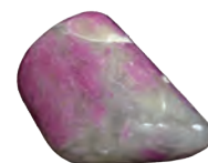
ルビーコーディエライト