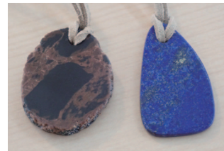
ペンダント型の十勝石とラピスラズリ