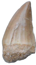
モササウルスの歯(実物) 中生代