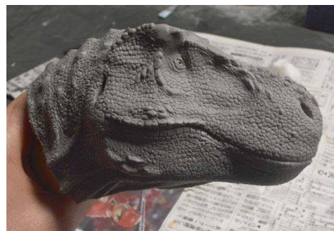
ティラノサウルスの生首が登場!

古生物模型づくりに、新しい種類が登場! 北海道当別町で発見され、名前がつけられました。