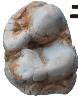
ゴンフォテリウムの歯(レプリカ) 新生代