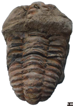
三葉虫(実物) 古生代