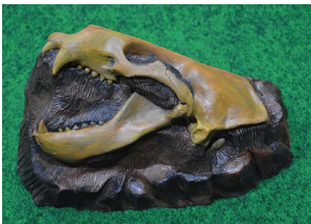
アーケオドベヌス(牙の短いセイウチ)

古生物模型づくりに、新しい種類が登場! 北海道当別町で発見され、名前がつけられました。