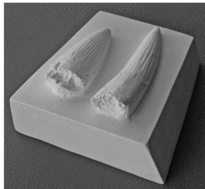
2本並んだスピノサウルスの歯

好評の「化石体験：レプリカづくり」。以前から要望の多かった「恐竜の歯」ができあがりしました。連休を目前に控えた4月29日から、化石工房でつくることができます。