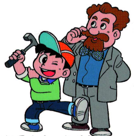
ケンタ君とホッシル博士 「マンガで解説する足寄の化石」より

現地には各自の車で行っていただきます。 長距離を歩くことはありませんが、すこし冒険もあります。