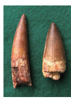
スピノサウルスの歯