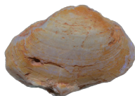
オパール化した貝化石